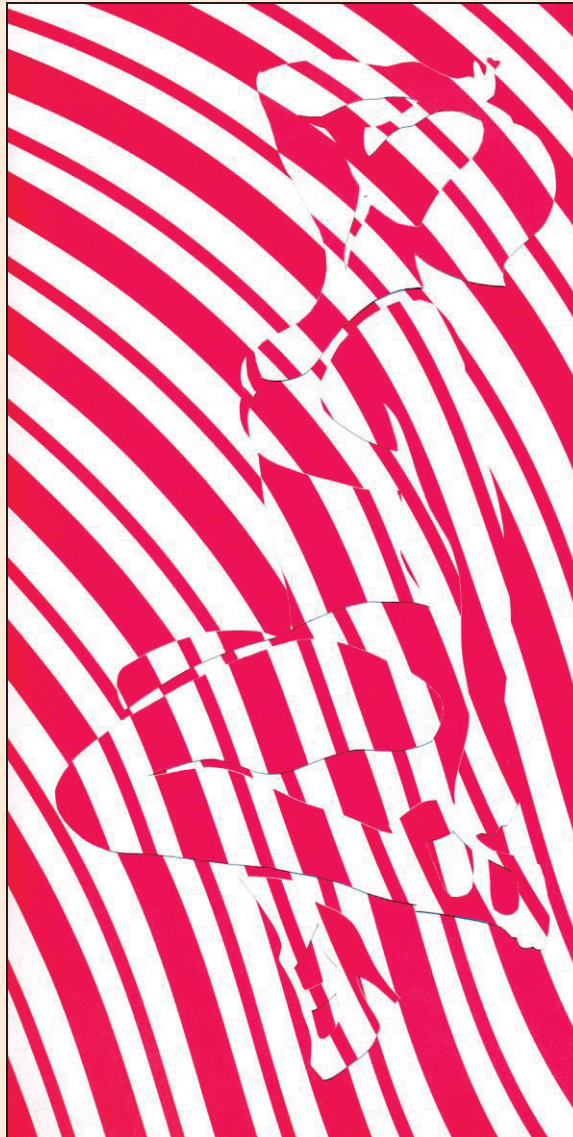
Heaven knows I'm miserable now